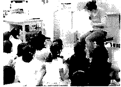
ボランティア「よみきかせ隊」による 読み聞かせ